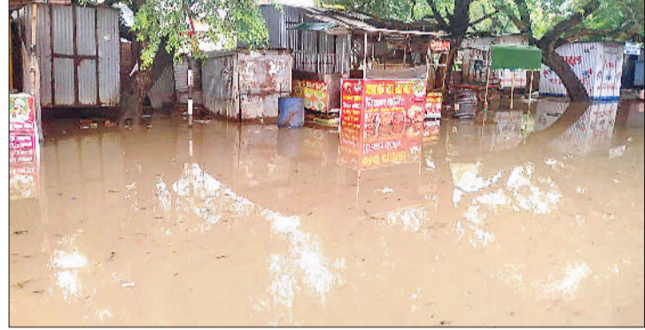
मंडी अटेली। नारनौल-रेवाड़ी रोड पर अटेली अनाज मंडी के सामने जमा पानी।

नारनौल। गरीबों के सरसों तेल पर महंगाई की मार पड़ी है। सरकार द्वारा राशन डिपुओं पर गरीबों को जो सरसों का तेल 20 रुपये प्रति लीटर उपलब्ध करवाया जाता था, अब उसके 50 रुपये अढ़ा करने होंगे। एक राशन कार्ड पर दो लीटर सरसों तेल दिया जाता है, जिसका अब 100 रुपये दो लीटर का अढ़ा करना पड़ेगा। खाद्य, नागरिक आपूर्ति एवं उपभोक्ता मामले निदेशालय की ओर से जारी आदेश पत्र क्रमांक:एफजी-1-1198/2025/9836 दिनांक:01/07/2025 के मुताबिक प्रदेश के सभी जिला खाद्य एवं पूर्ति नियंत्रक को आदेश दिए जा रहे हैं कि सरसों के तेल के अब उपभोक्ताओं से 100 रुपये प्रति दो लीटर के हिस्से से वसूल किए जाएं। संयुक्त निदेशक की ओर से जारी पत्र में उल्लेख किया गया है कि विषयवस्तु अवगत कराया जाता है कि राज्य सरकार द्वारा पीडीएस के तहत वितरित किए जाने वाले फॉर्टीफाइड सरसों के तेल का उपभोक्ता मूल्य 100 रुपये प्रति दो लीटर निर्धारित किया गया है। इसलिए जुलाई माह से लाभार्थियों से दो लीटर सरसों तेल के 100 रुपये वसूल किए जाएं।