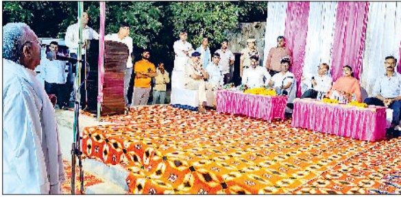
महेंद्रगढ़। लोगों की शिकायत सुनते डीसी व एसपी।